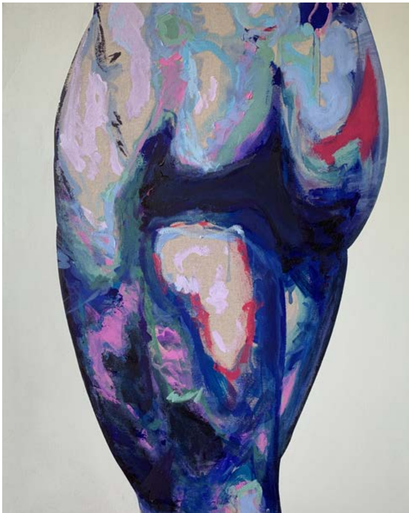
DERRICK VARIATION 1 80X100 Acrylique sur toile