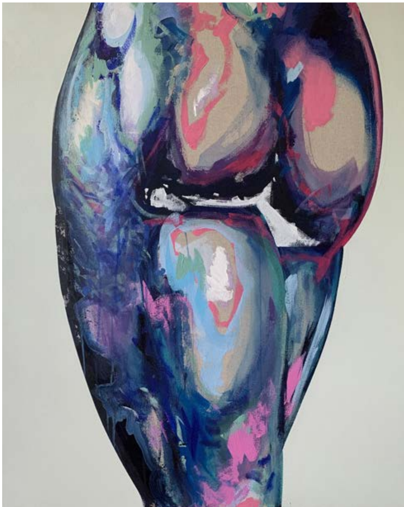
DERRICK VARIATION3 80X100 Acrylique sur toile