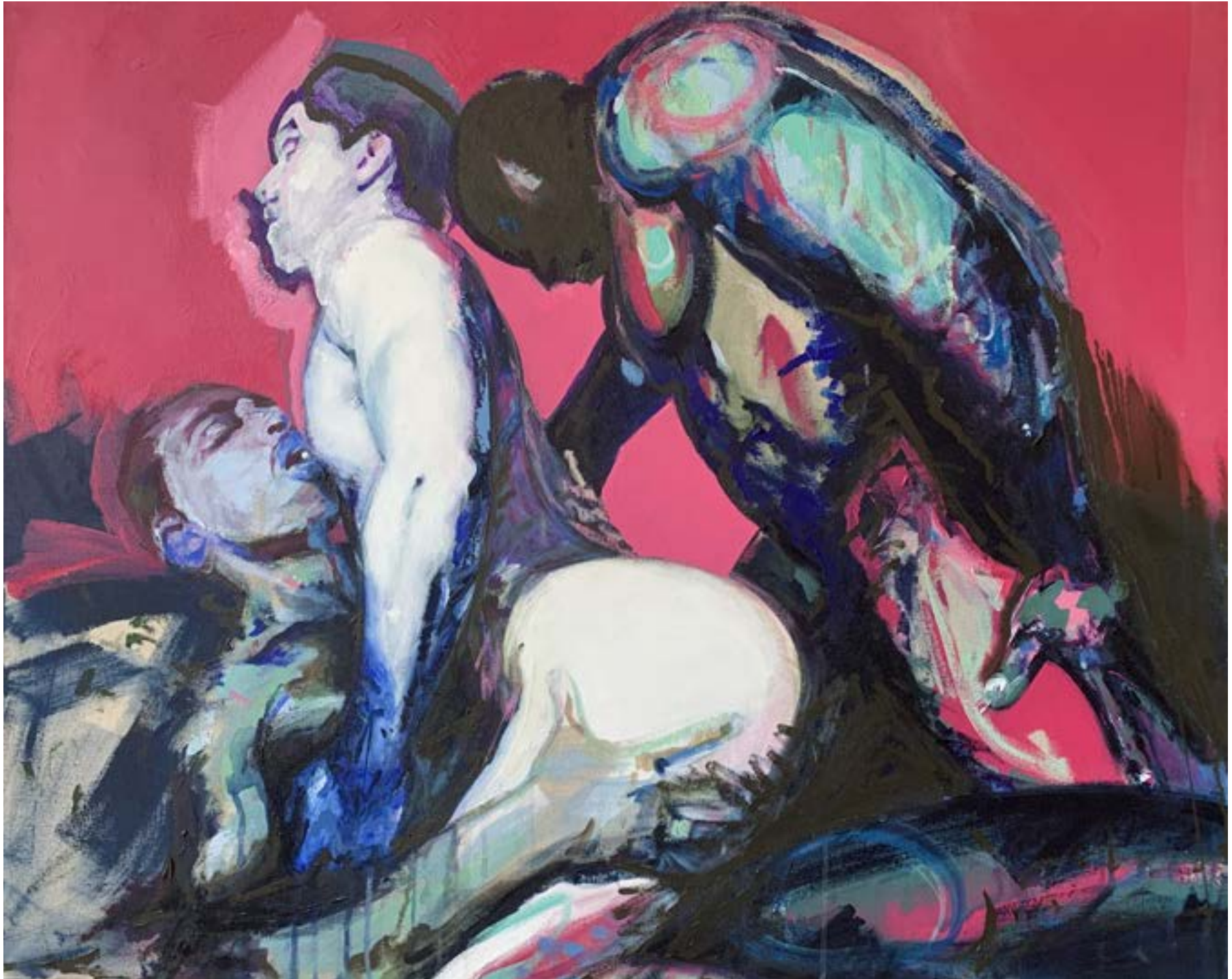
AUTO-PORTRAIT 2 100X80 Acrylique sur toile