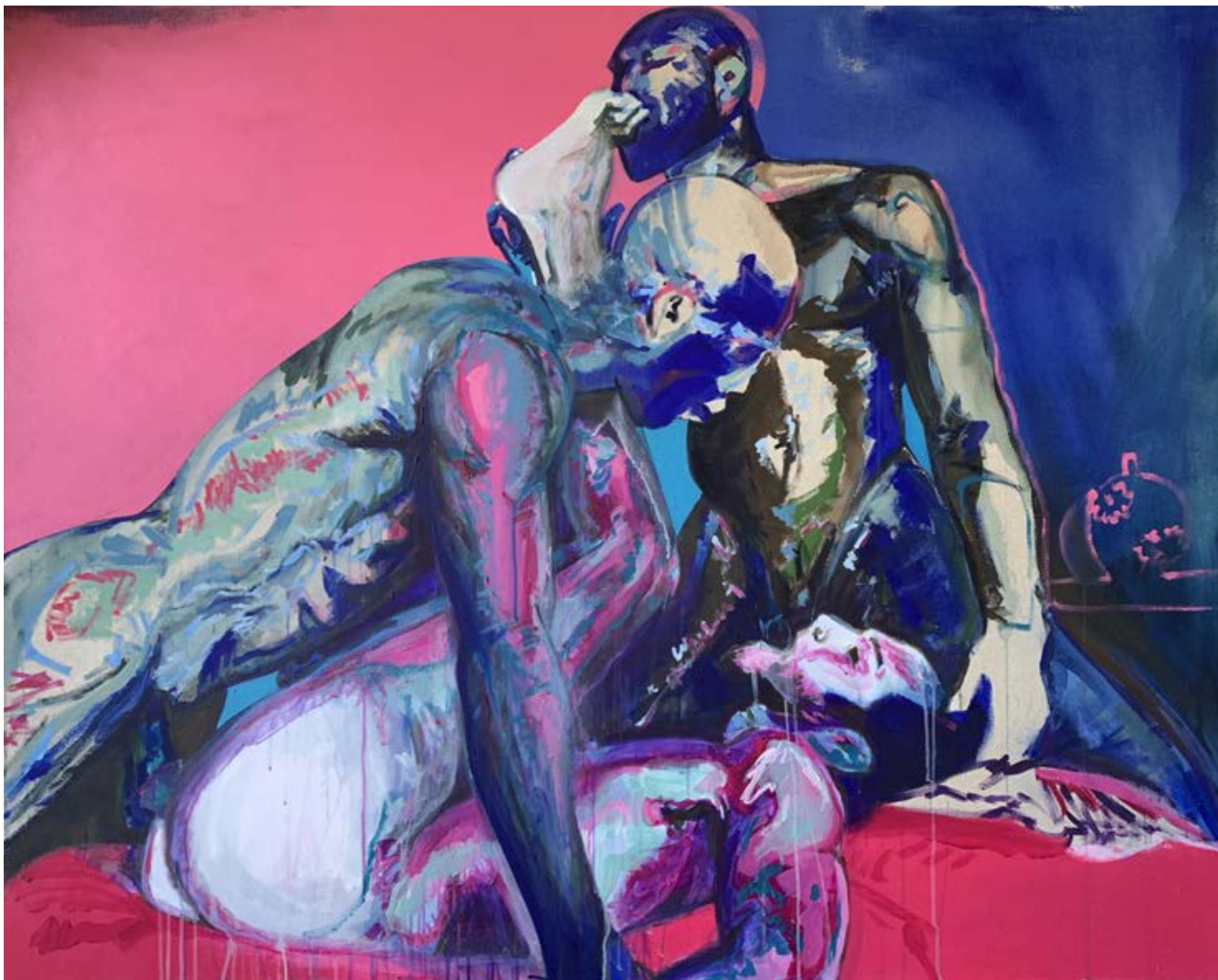
AUTO-PORTRAIT 1 150X120 Acrylique sur toile