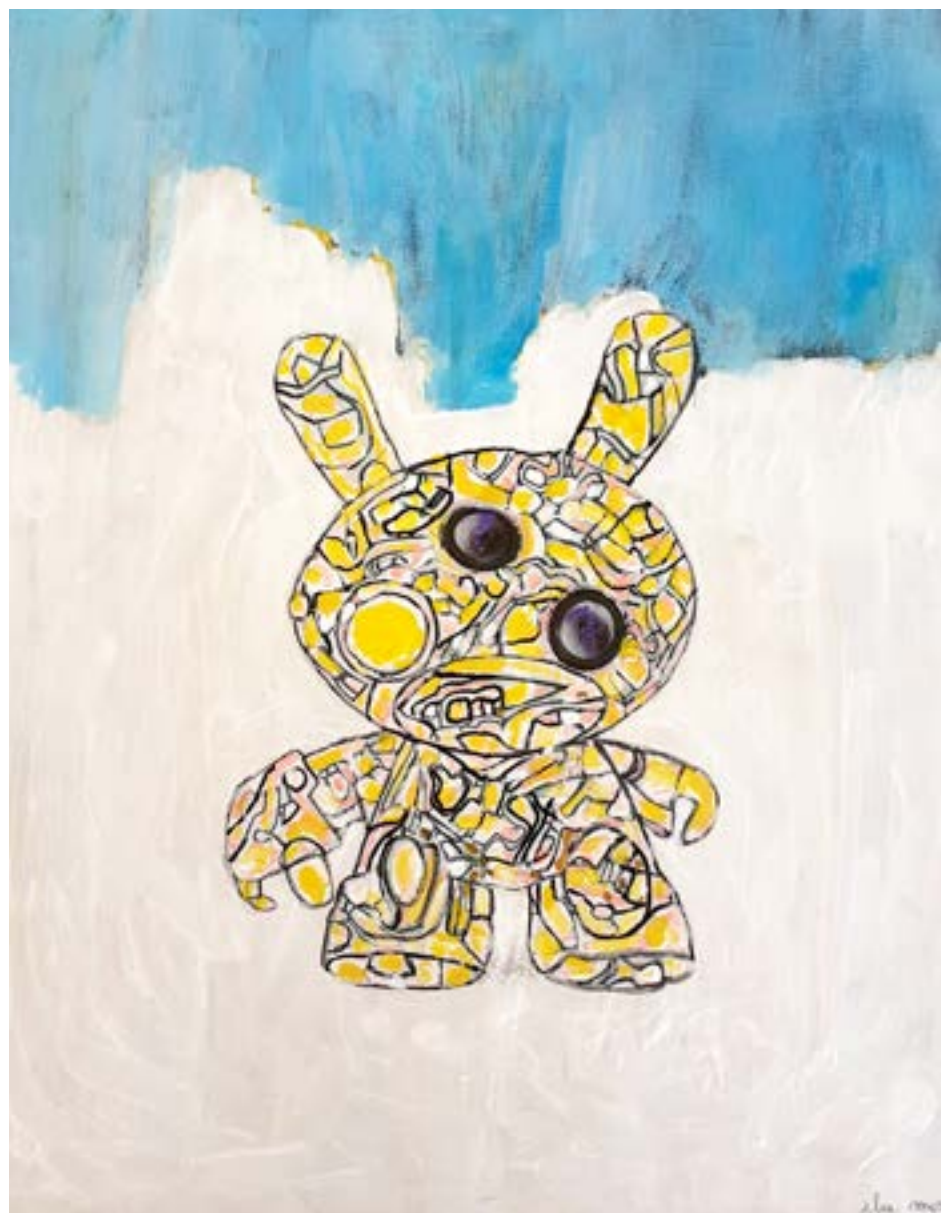
8-«Lepus Pupa», 47 x 40 cm -400€