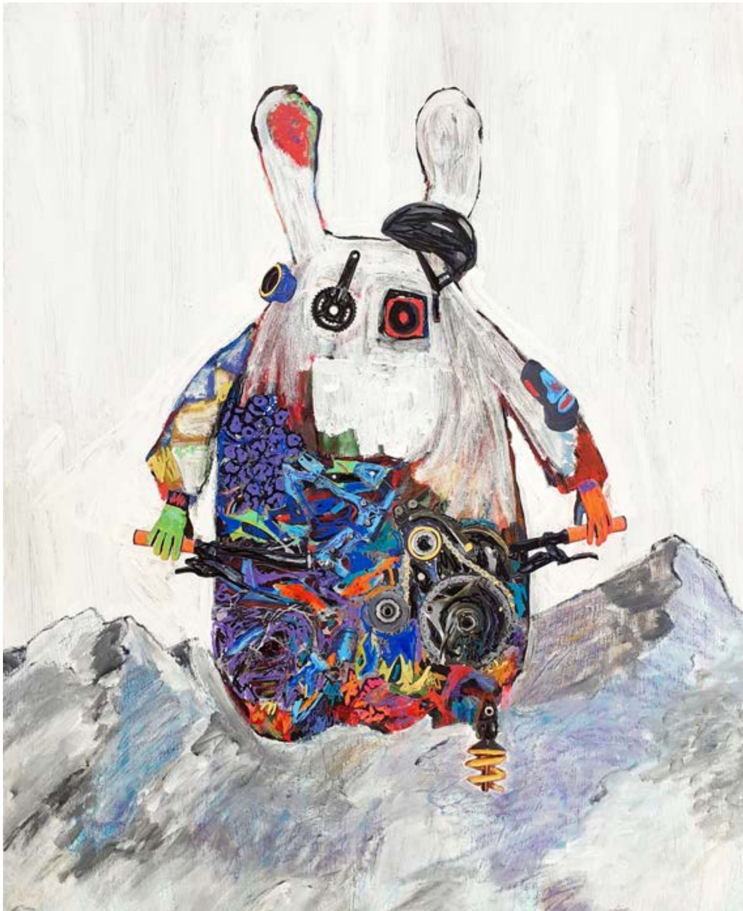
10-«Lepus Machina», 110 x 90 cm - 1500€