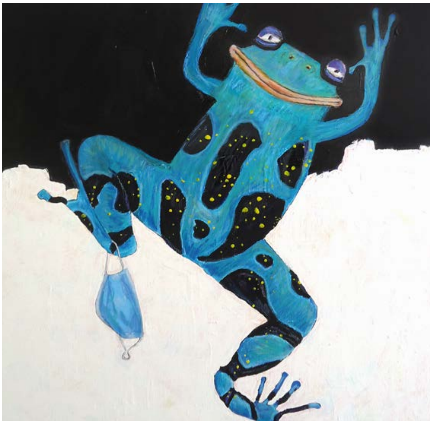
5-«Rana Festivum», 95 x 95 cm - 1300€