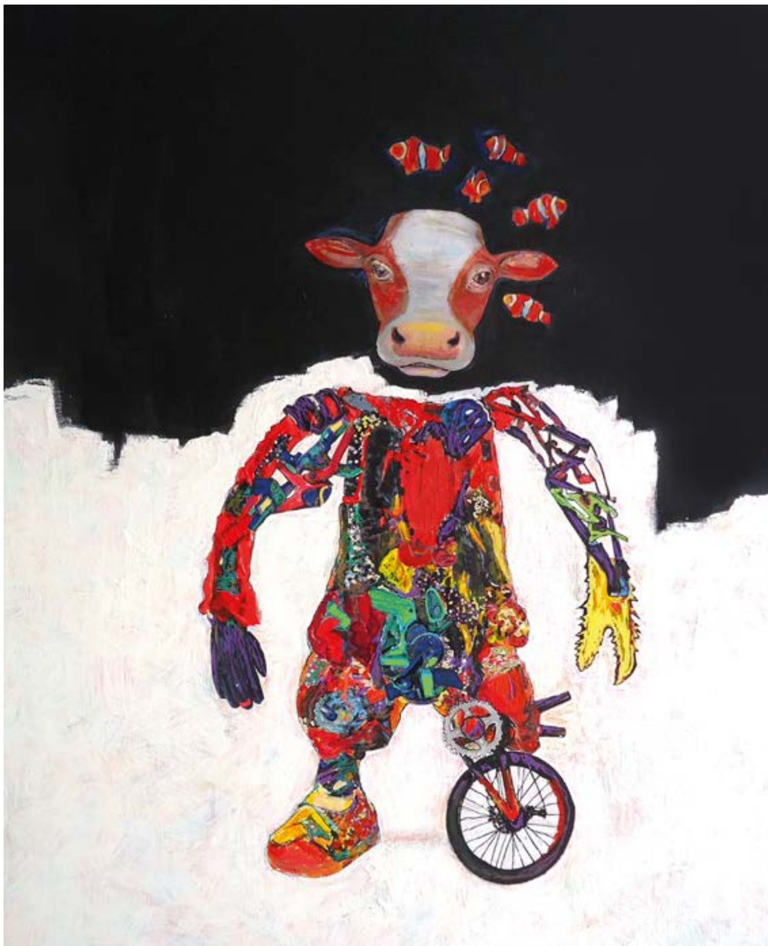
3-«Bovis Machina», 120 x 95 cm -1800€