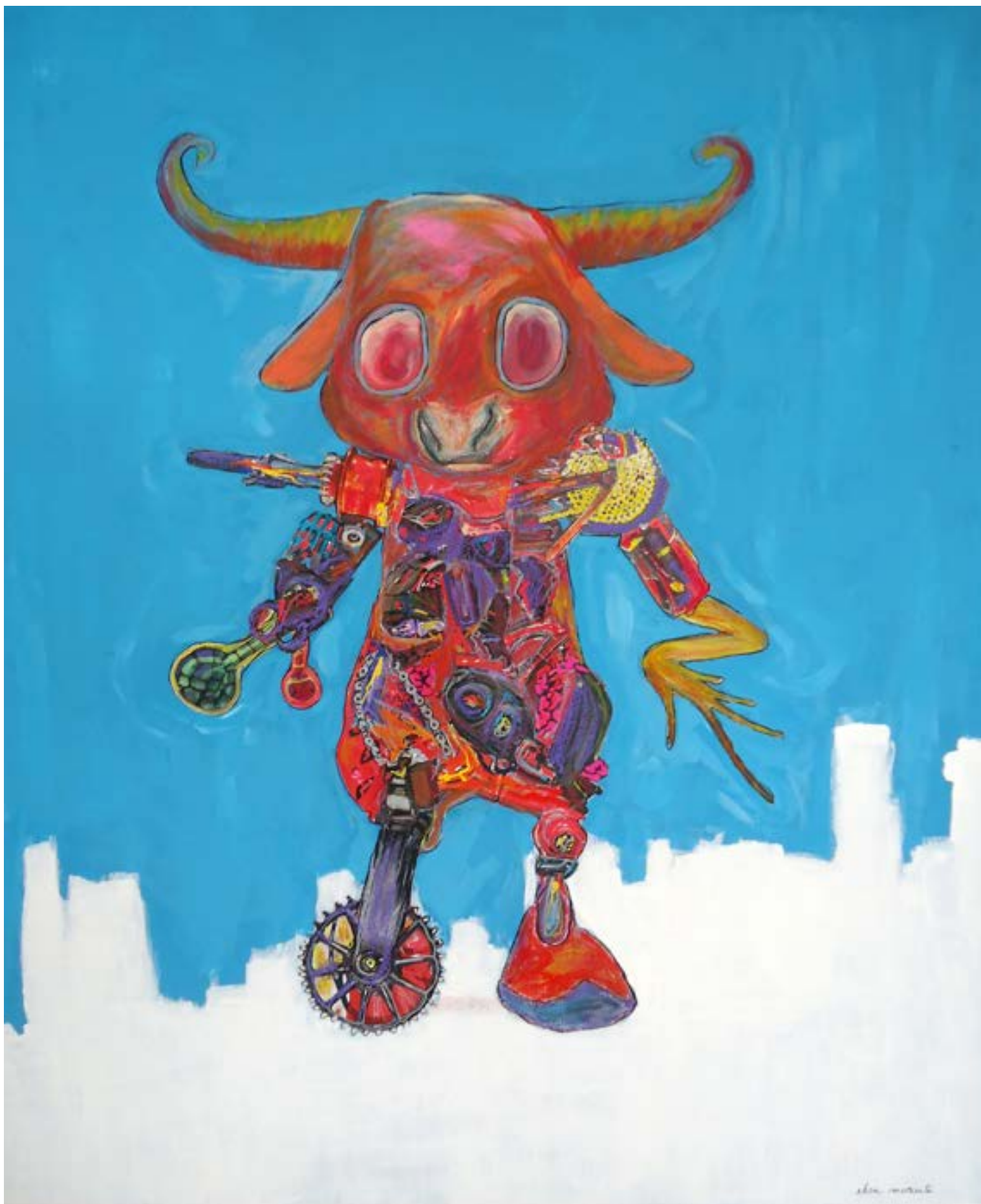
1- «Sanguis Bovis», 120 x 100 cm -1800€