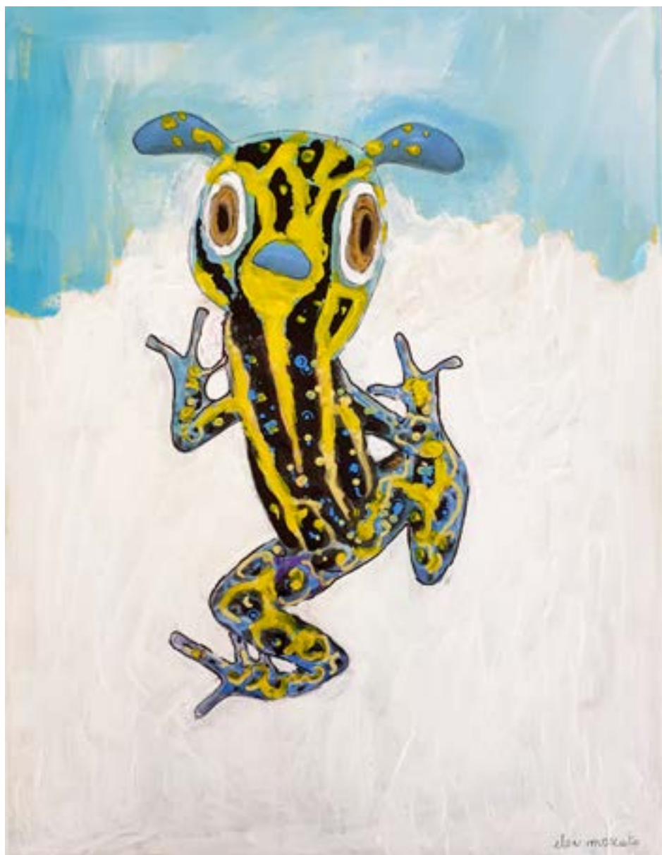
9-«Canis Rana», 47 x 40 cm -400€