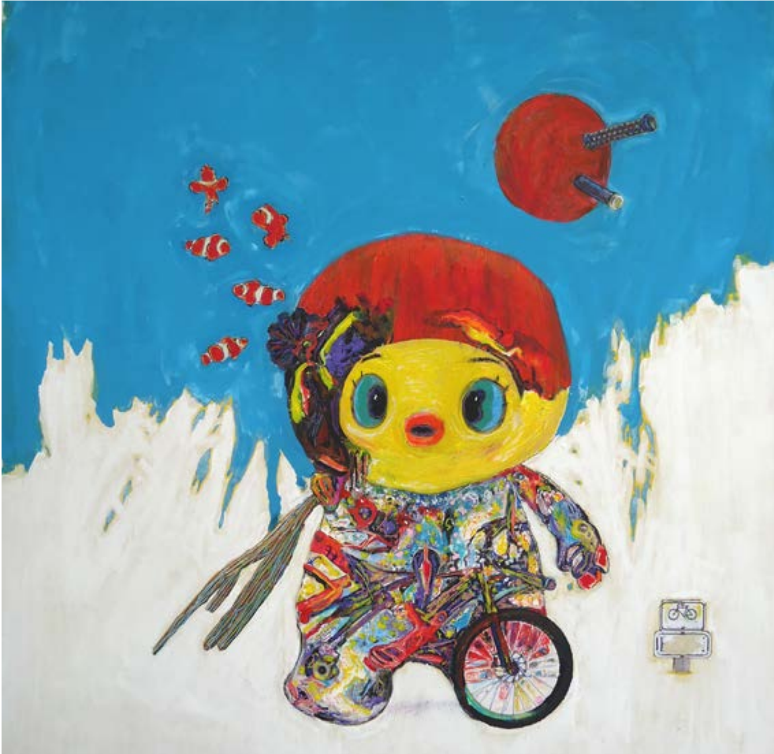
6-«Pullus Fuga», 100 x 100 cm - 1400€