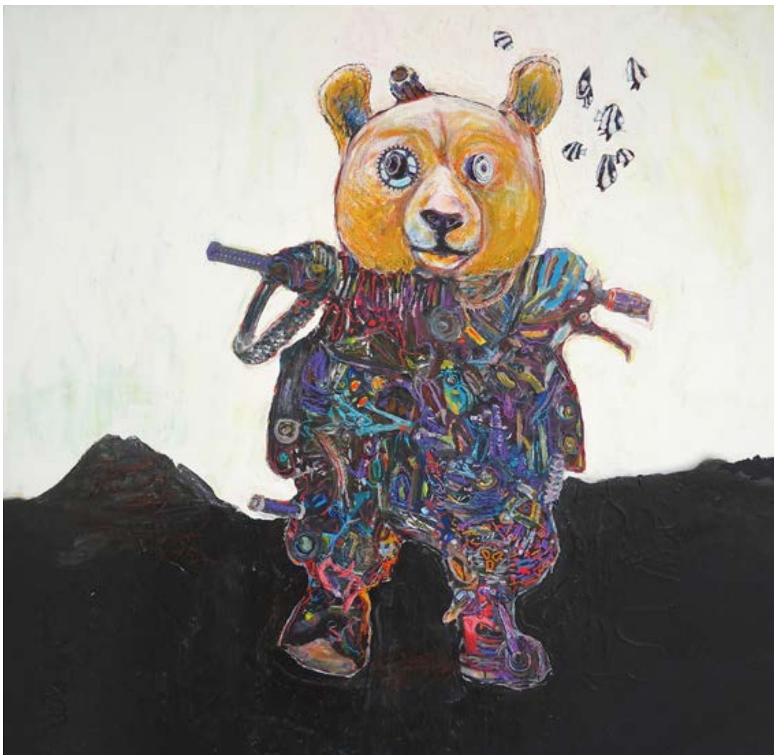
7-«Ursa Lava», 100 x 100 cm - 1400€