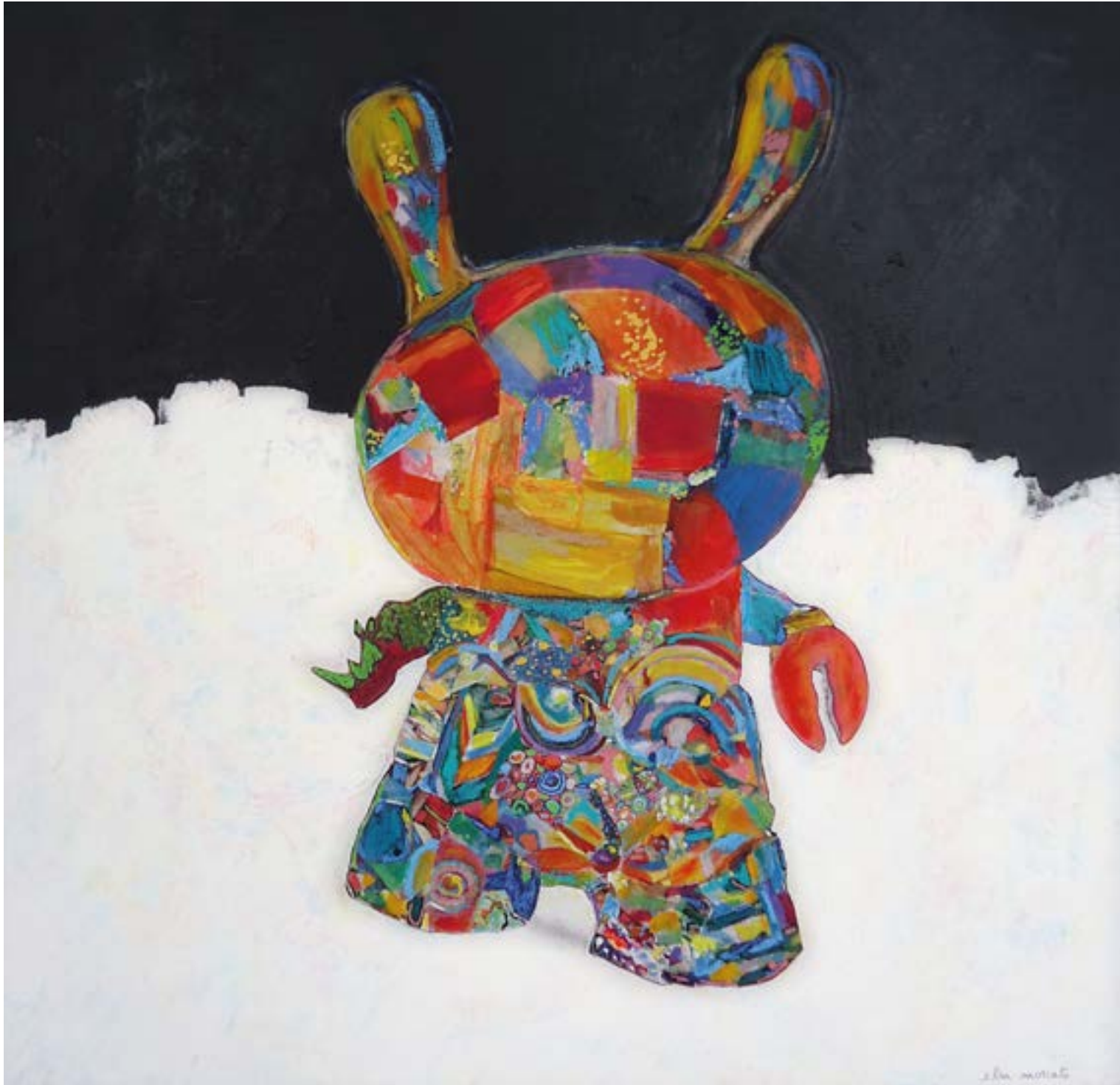
4-«Lepus Fibula», 95 x 95 cm -1300€