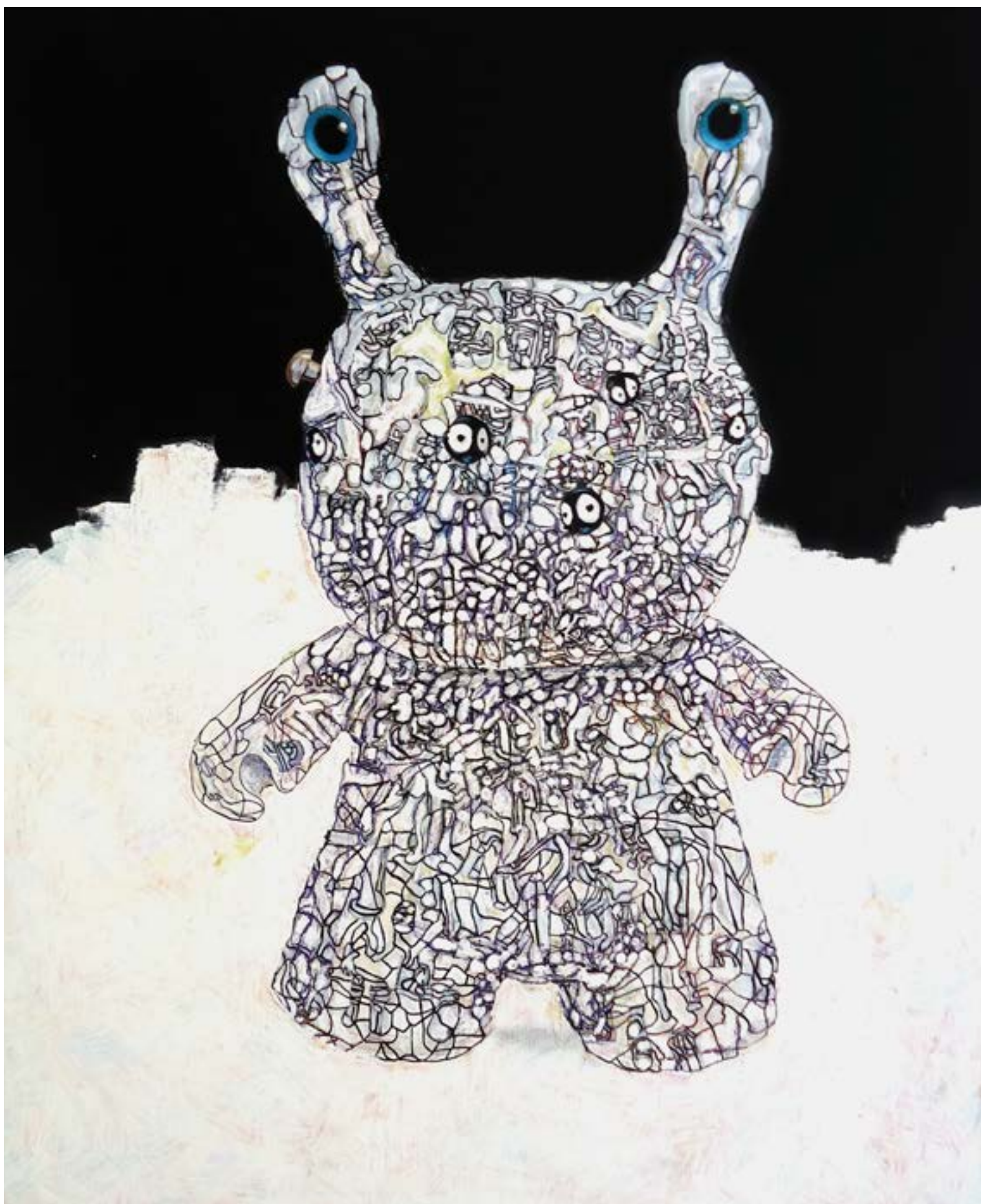
2-«Lepus Cochela», 120 x 95 cm -1800€