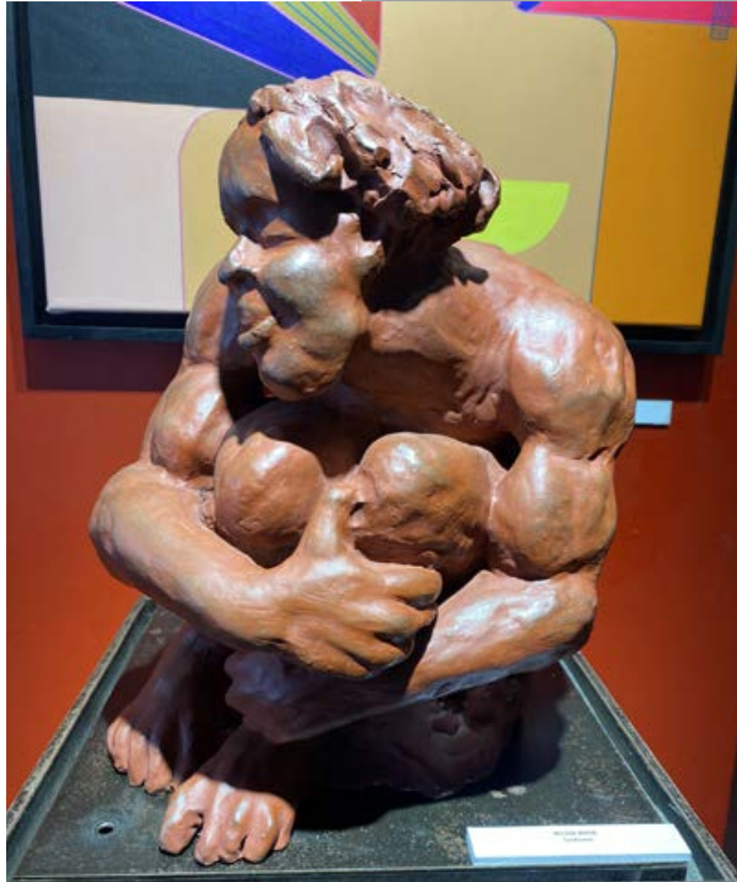
01-NELSON BOYER - Tendresse - Terre cuite - 1200€